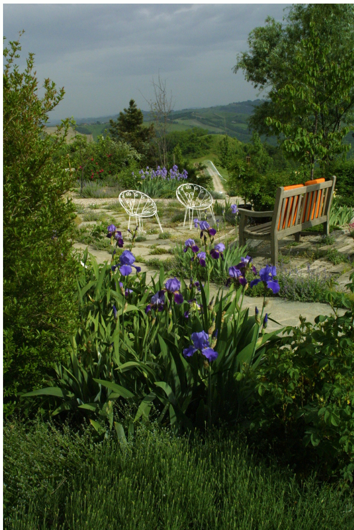
Parco del Museo Giardino della Rosa Antica