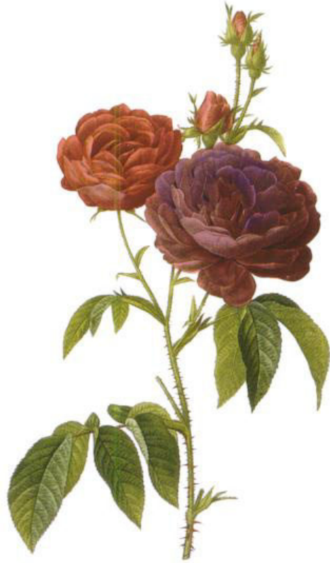
Rosa Gallica Officinalis, La Rosa Gallica Officinalis.

L'origine di questa rosa risale a ben prima dei tempi del Rinascimento. Una delle leggende sulla sua origine ne testimonia l'uso già nell'antica Persia. Si racconta che la sfrenata passione per la rosa bianca indusse un usignolo a rubare con furtiva fretta il meraviglioso fiore. Il sangue fuoriuscito dalla ferita, procurata dai rami spezzati, colorò di porpora i petali di rosa bianca..