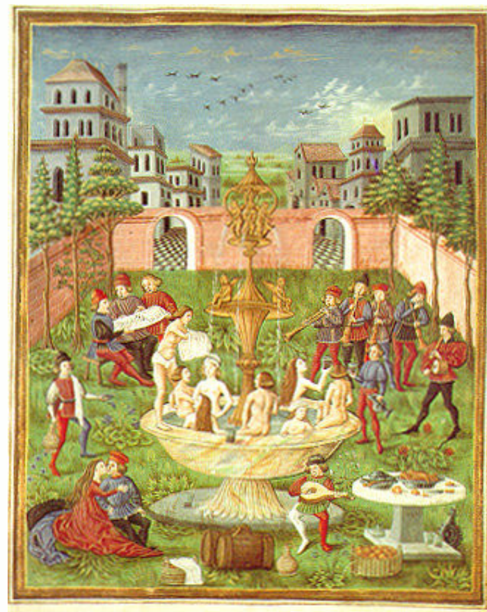
Fontana della Gioinezza, miniatura da De Sphaera, XVsec.

La casa editrice Il Bulino, fondata nel 1980, ha sede in Modena ed esercita un ruolo significativo nelle attività culturali europee ma anche cittadine, in particolare attraverso la collaborazione con la Biblioteca Estense Universitaria, con l'Archivio di Stato e con l'Archivio Diocesano per la valorizzazione del nostro rilevante patrimonio librario. La filosofia editoriale è incentrata su due filoni di ricerca e di produzione: da una lato la storia del libro illustrato, nelle collane "Il giardino delle Esperidi" e "Studi e ricerche"; dall'altro la riproposizione in facsimile dei capolavori dell'arte miniatoria medievale e rinascimentale.