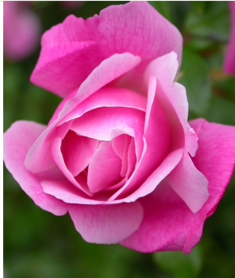
Rosa General Shablikine