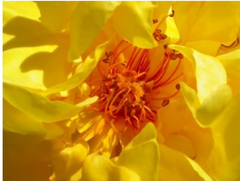
Rosa Golden Showers